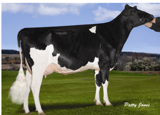
STANTONS FREDDIE CAMEO