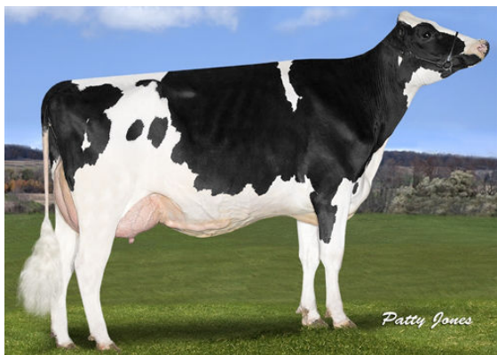
STANTONS CAMEO APPEARANCE