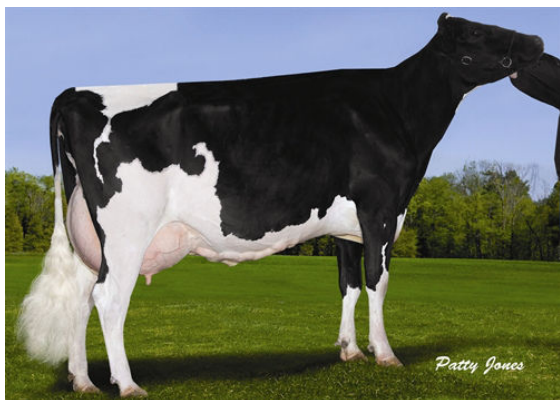
STANTONS LUCKY CAMEO