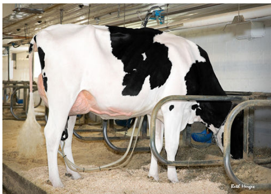
REGAN-DANHOF JEDI CASHMERE