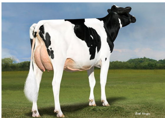
REGAN-DANHOF JEDI CASHMERE