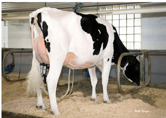
REGAN-DANHOF JEDI CASHMERE