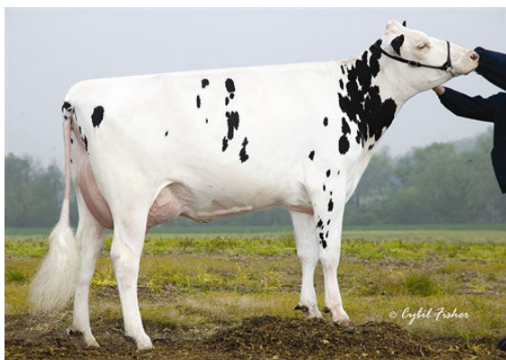
ART-ACRES KAY721 FIFTH DAM