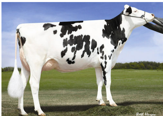
MS C-HAVEN OMAN KOOL FOURTH DAM