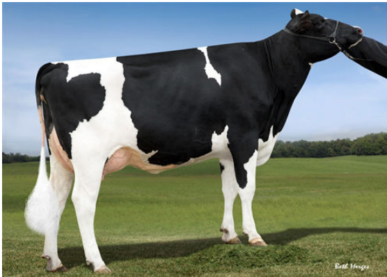
WESSELCREST GRAFET LAKIN