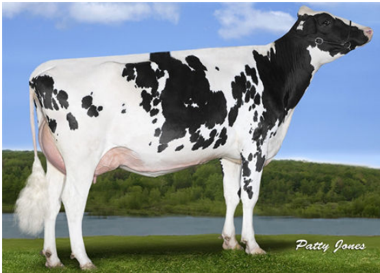
GILLETTE JEDI CLEAVAGE GRANDDAM