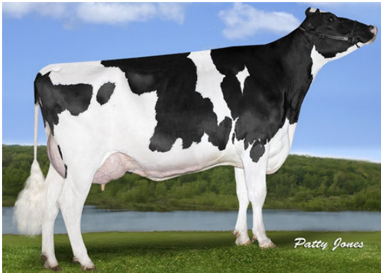
CLEAR-ECHO MCUTCHEN 2820 FOURTH DAM