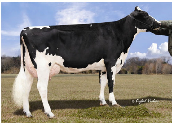
CLEAR-ECHO M-O-M 2213 FIFTH DAM