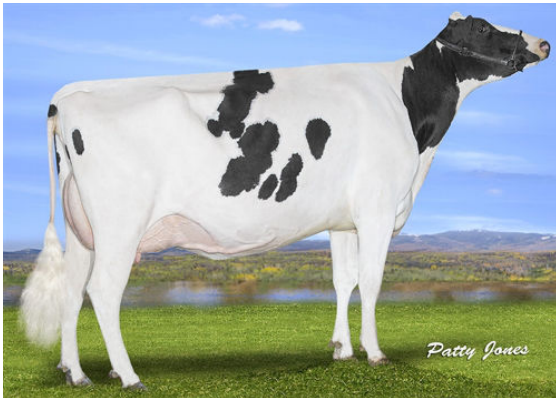
PROGENESIS BAYONET THRUST