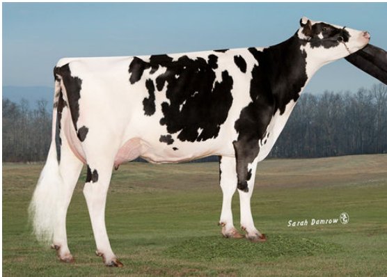
CO-OP BLUMEN DAY 4292