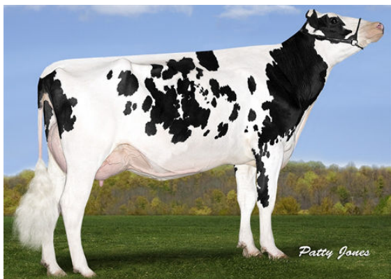
SILVERRIDGE V MUNITION EARWIG