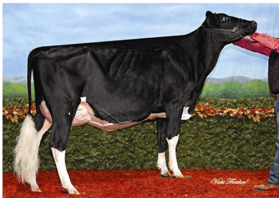
PHILLHAVEN STEADY BREEZE