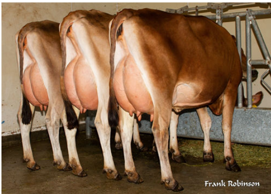
RIVER VALLEY CIRCUS CRAZE DAUGHTERS L to R - AHLEM CRAZE AUTUMN 52313, AHLEM CRAZE MARIE 52311, FOREST CRAZE FRANCINE