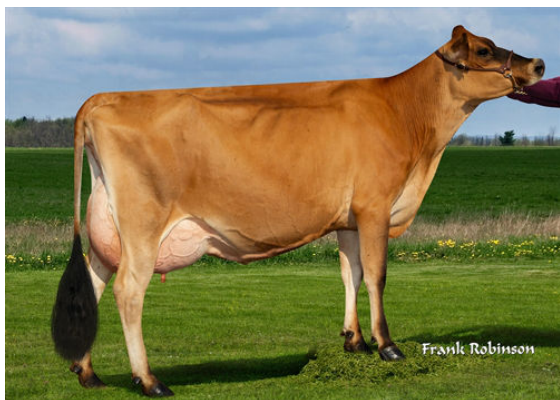
JX VIERRA DORY {4} GRANDDAM