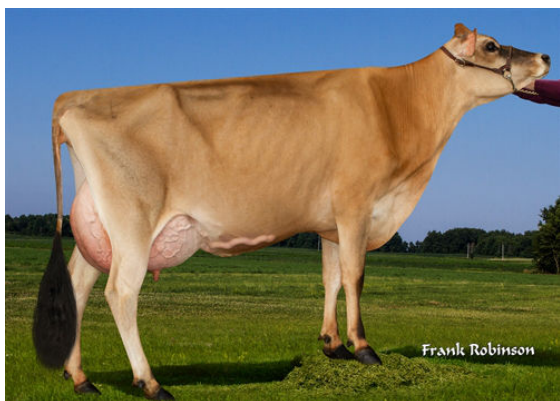
JX SCHULTZ VANDRELL DEXXIE {3} THIRD DAM