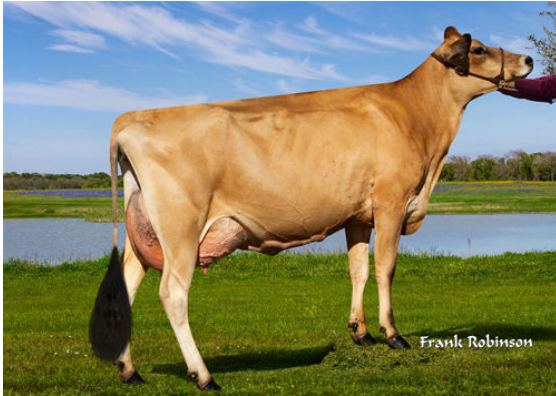
JX LUCKY HILL WILDFLOWER {6} GRANDDAM