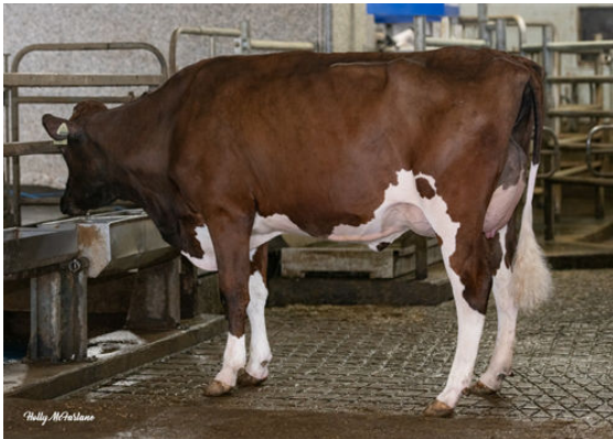
PROGENESIS CHAMPION TIANNA DAUGHTER