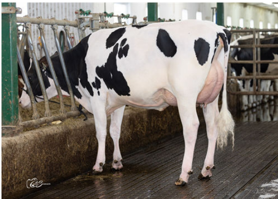
ANTIA SPEEDUP MILOUNY DAUGHTER