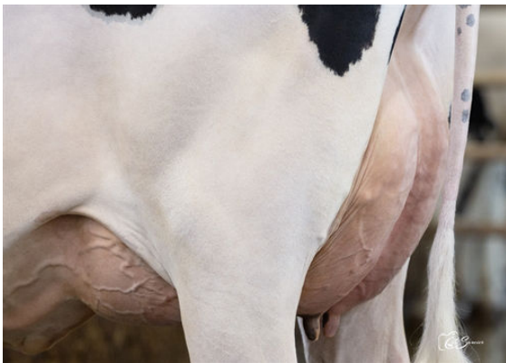
ANTIA SPEEDUP MILOUNY DAUGHTER