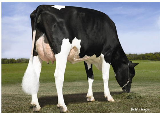
FLY-HIGHER OBSERV MICA FOURTH DAM