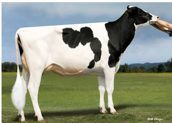
PROGENESIS JEDI HANSOLO