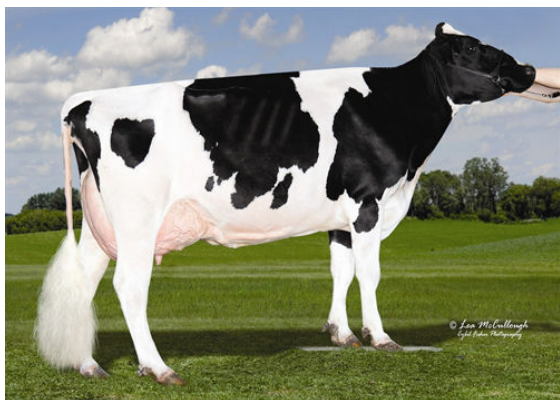
OCD PLANET DANICA