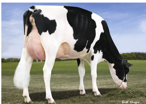
MORSAN MAN D MISSY