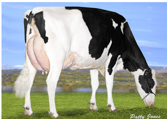
OCD DELTA MISSY