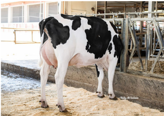
PROGENESIS MAVERICK MOVER