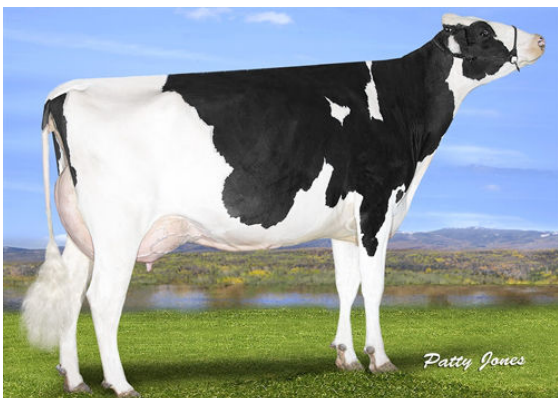
OCD DELTA MISSY