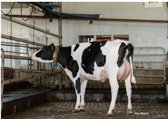
PROGENESIS MAVERICK MOVER