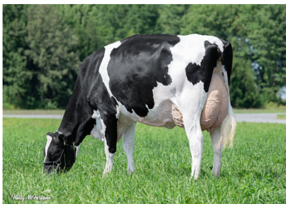
REDLODGE RANDALL AMBROSIA DAUGHTER