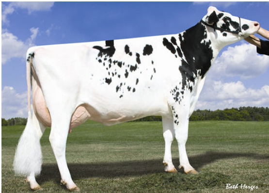
LARCREST COMET-ETS THIRD DAM