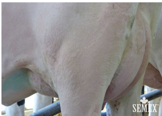
DESLACS INTEGRAL ANARICK