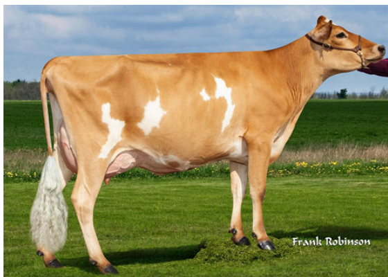
PROGENESIS CRAZE CORD {6} DAUGHTER