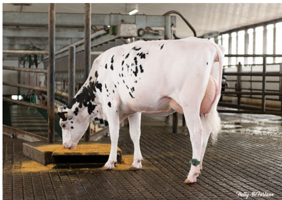
STANTONS PURSUIT OF JUSTICE DAUGHTER