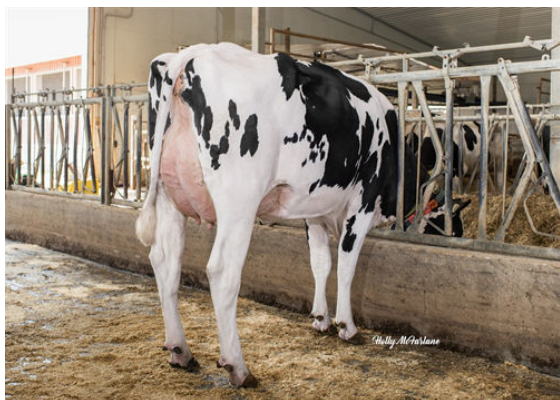
PROGENESIS IMAX PERFECTION