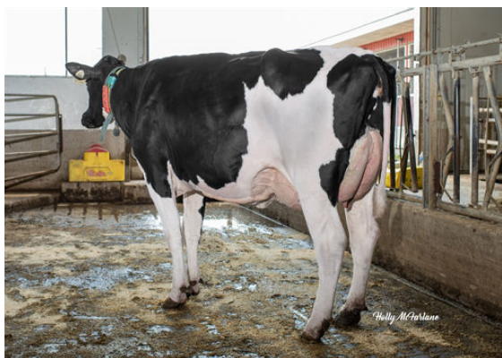
PROGENESIS IMAX HIJINKS