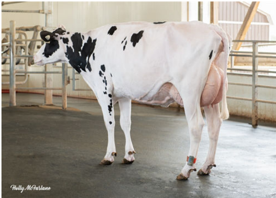
LARENWOOD ALLIGATO CRAZY 1114 DAM