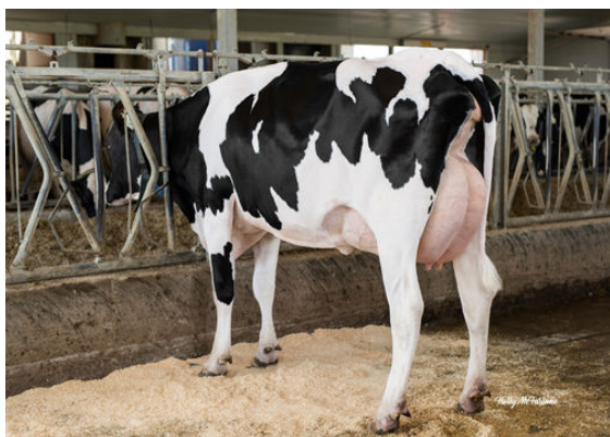
PROGENESIS FABULOUS BRISK DAM