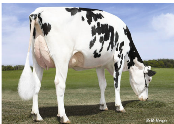
MS C-HAVEN OMAN KOOL FOURTH DAM