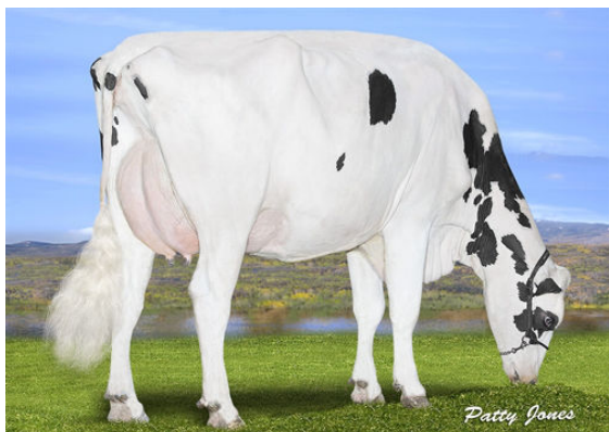
PROGENESIS DETOUR KANSAS DAM