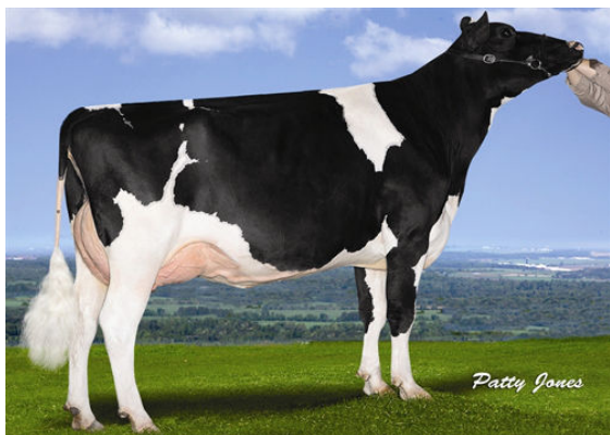
MS LOOKOUT PESCE NISSA