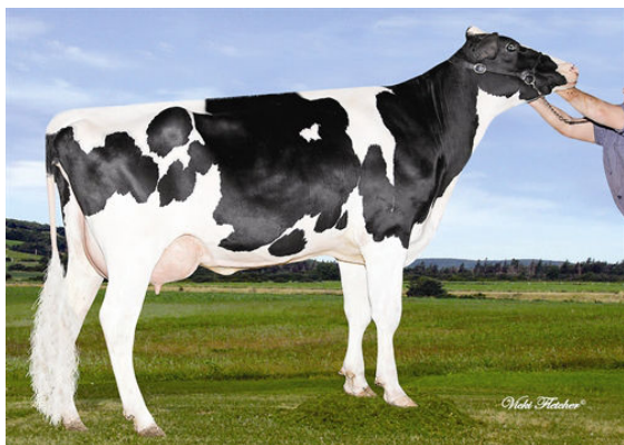
GINARY OMAN OMAN MARLENE