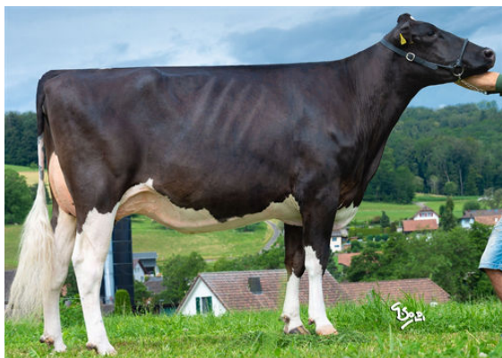
HIMEYERS SUPERHERO BRITNEY DAM