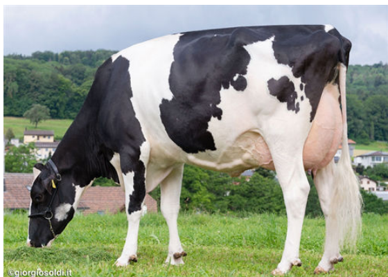
HIMEYERS MCCUTCHEN BRENYA GRANDDAM