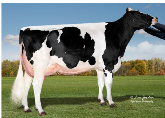
COOKIECUTTER HOPELYNN GRANDDAM