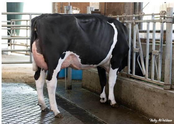
WESTCOAST FSTBL FAR8167 10707