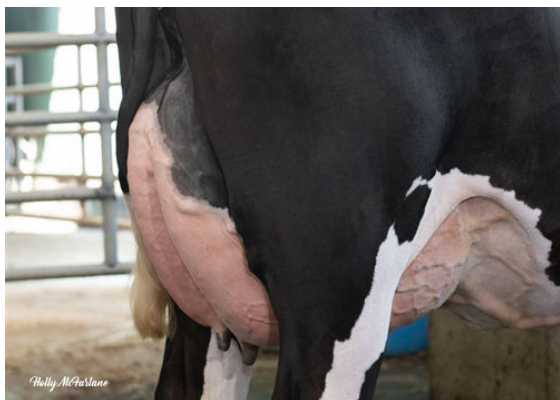
WESTCOAST FSTBL FAR8167 10707