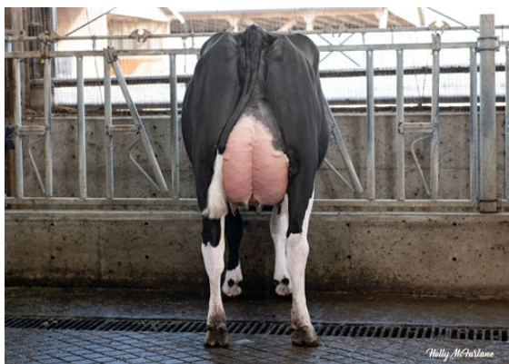
WESTCOAST FSTBL FAR8167 10707