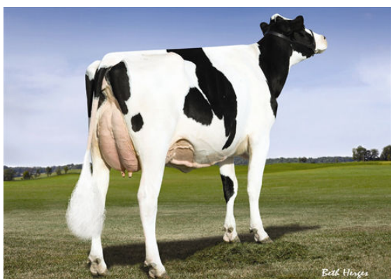
LADYS-MANOR DORCY ODA THIRD DAM