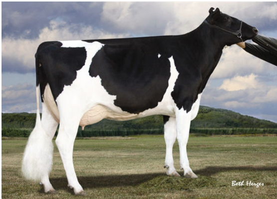
KHW GOLDWYN AIKO FIFTH DAM