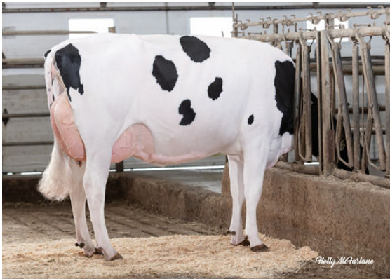
PROGENESIS EINSTEIN WIMZY DAUGHTER