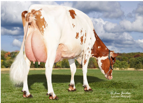
AOT SWINGMAN HALIA-RED DAUGHTER