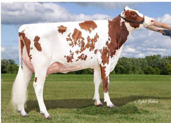
BACON-HILL SWNG RONE-RED DAUGHTER