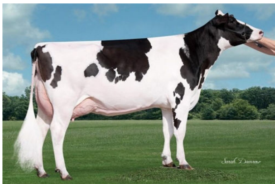
SIEMERS MCCUTCH ROZ