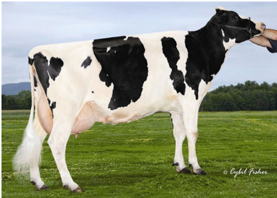
CLEAR-ECHO 822 LAUD 1266 FOURTH DAM