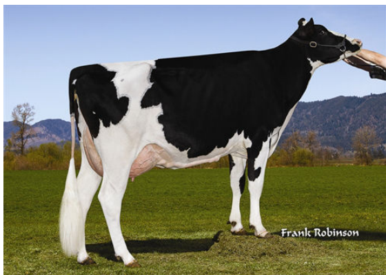
RONELEE FACEBOOK DARCY GRANDDAM