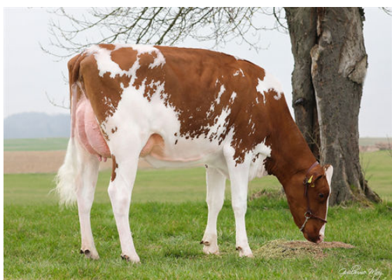
TERREAUX BRENACO KENDA DAUGHTER