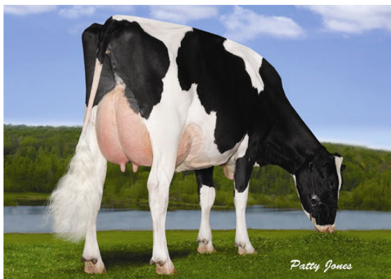
SANDY-VALLEY PLANET MELODY