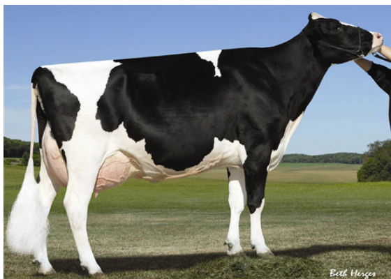
HENDEL BOLTON MUSIC 2602