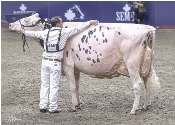
ERBACRES SNAPPLE SHAKIRA DAM