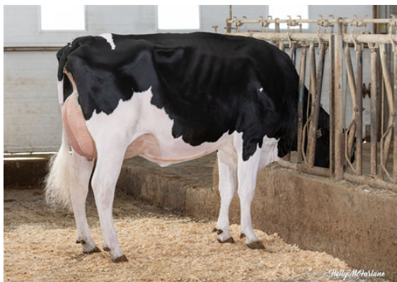
PROGENESIS HIGHJUMP LEADER DAM