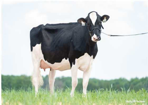
PROGENESIS HIGHJUMP LEADER DAM