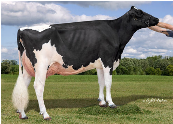
KINGS-RANSOM CASP DAZE