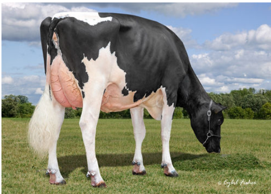
KINGS-RANSOM CASP DAZE