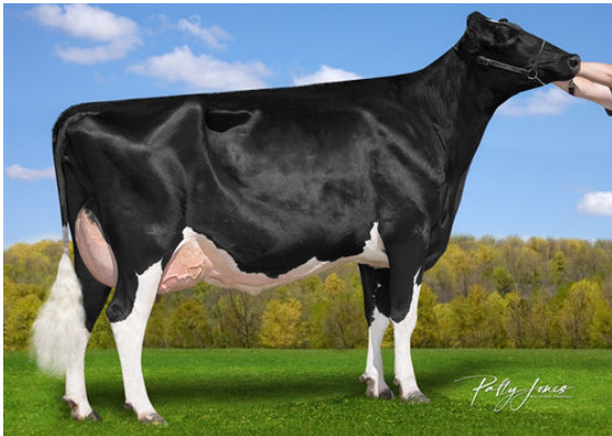
HANALEE IMPRESSION AUDI DAM