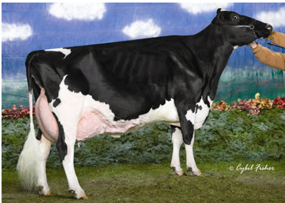
AMLAIIRD LEE ALICE FIFTH DAM