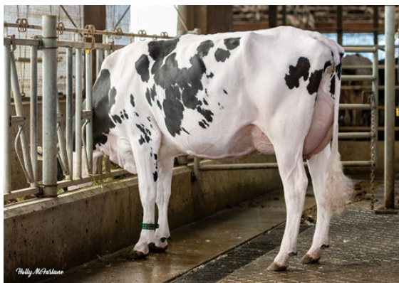
PROGENESIS MONTEVERDI LOOSE DAUGHTER