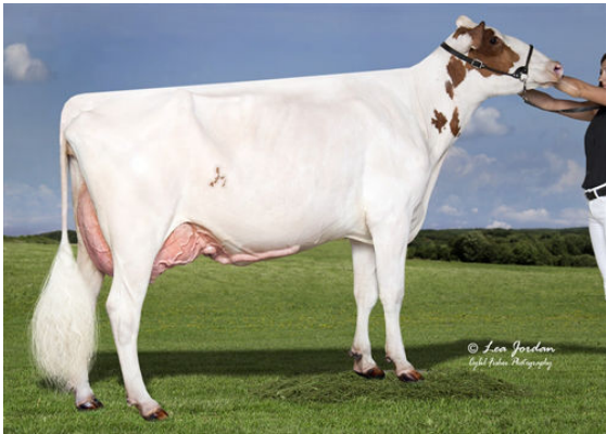
MIDAS-TOUCH ARIANA-RED GRANDDAM