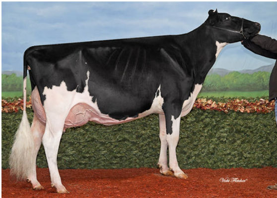
GEN-I-BEQ SNOWMAN AKILIANE THIRD DAM