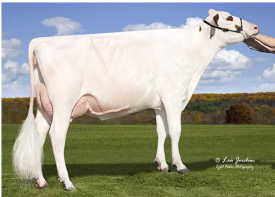
MIDAS-TOUCH AIRAINE-RED DAM