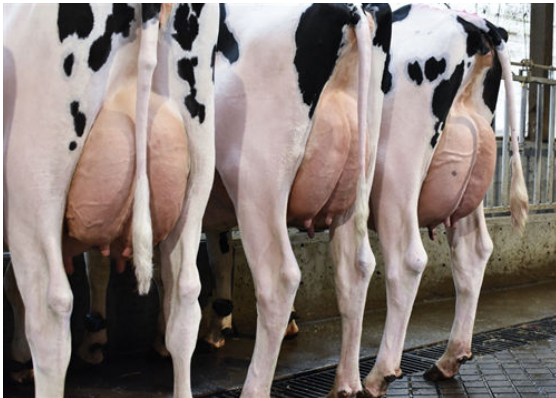
ALCOVE DAUGHTER GROUP L-R WESTCOAST ALCOVE KOO 7550, WESTCOAST ALCOVE LOYAL 8347, WESTCOAST ALCOVE SILV3063 8221