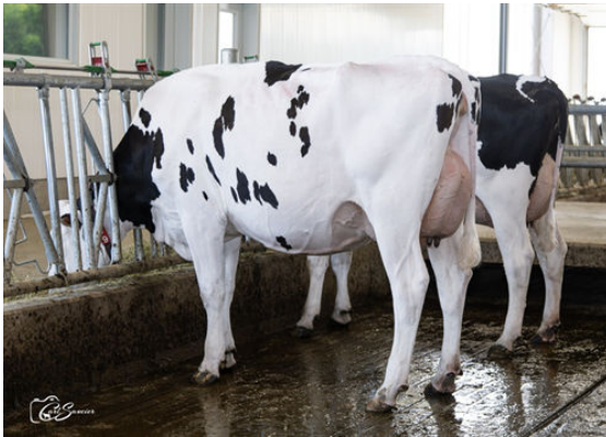
ROQUET I LOVE YOU BLUFF DAUGHTER