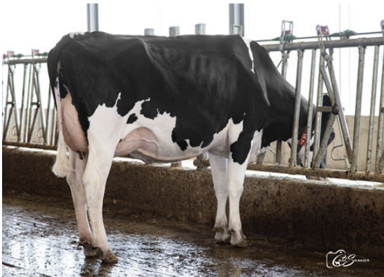
ROQUET CAPRICE BLUFF DAUGHTER