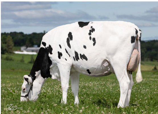
ROQUET I LOVE YOU BLUFF DAUGHTER