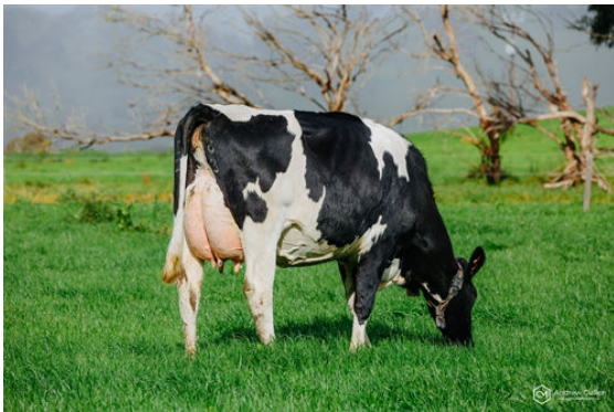
ROCKWELLA FARM PERSEUS JEWEL