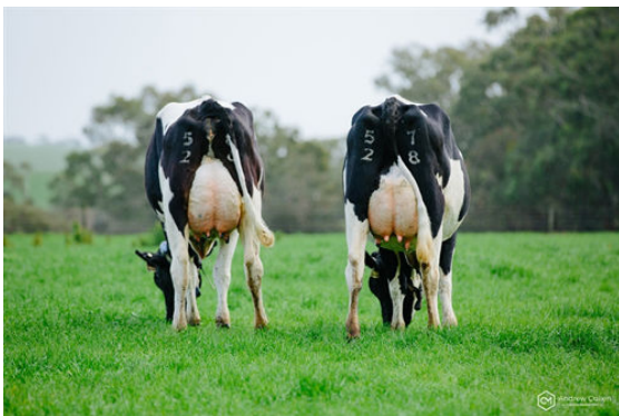
PERSEUS DAUGHTER GROUP

L-R KREZANDA PERSEUS DING 3 - KREZANDA PERSEUS DING