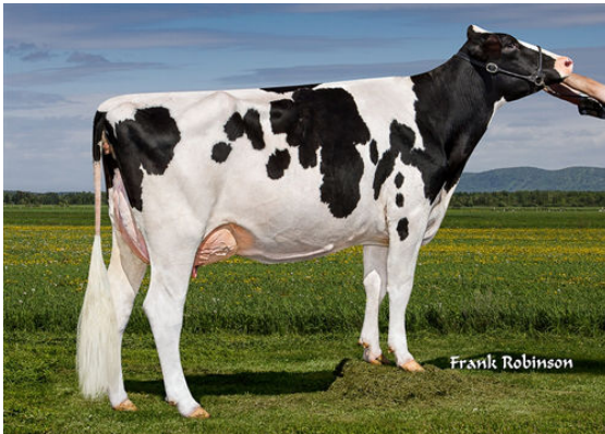
T-GEN-AC MOGUL JANAVEE DAM